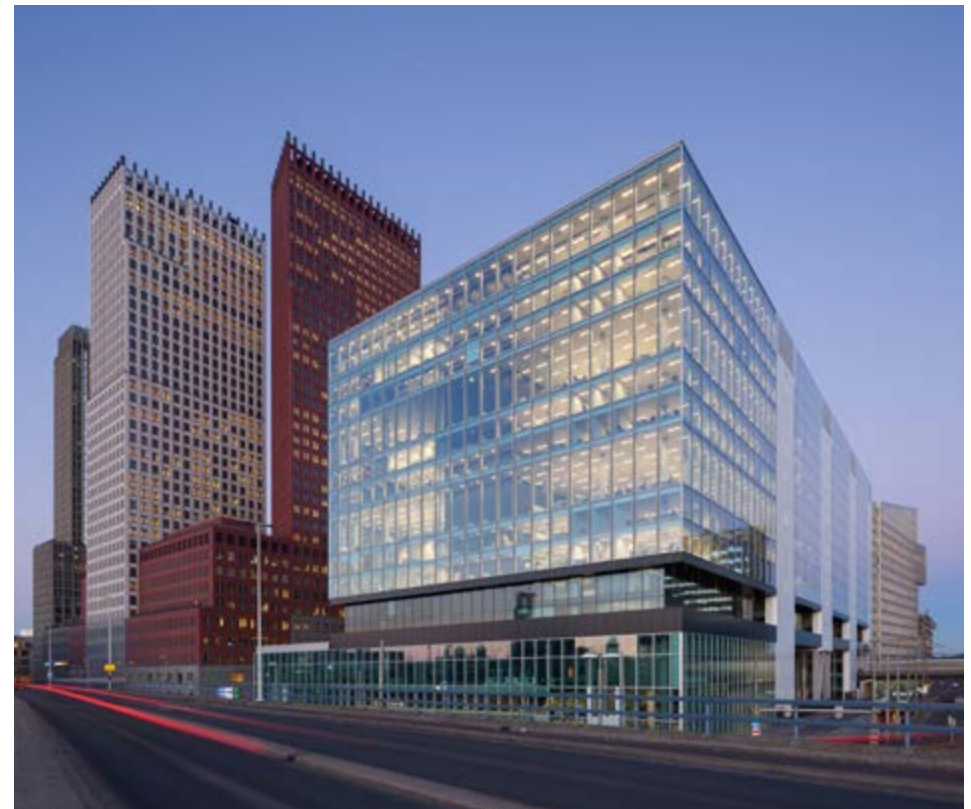
Foto: Gebouw aan Rijnstraat 8.

Waar moet je nu op letten bij de afweging om een stadsbatterij te plaatsen? In deze handreiking worden de opgedane ervaringen gedeeld.