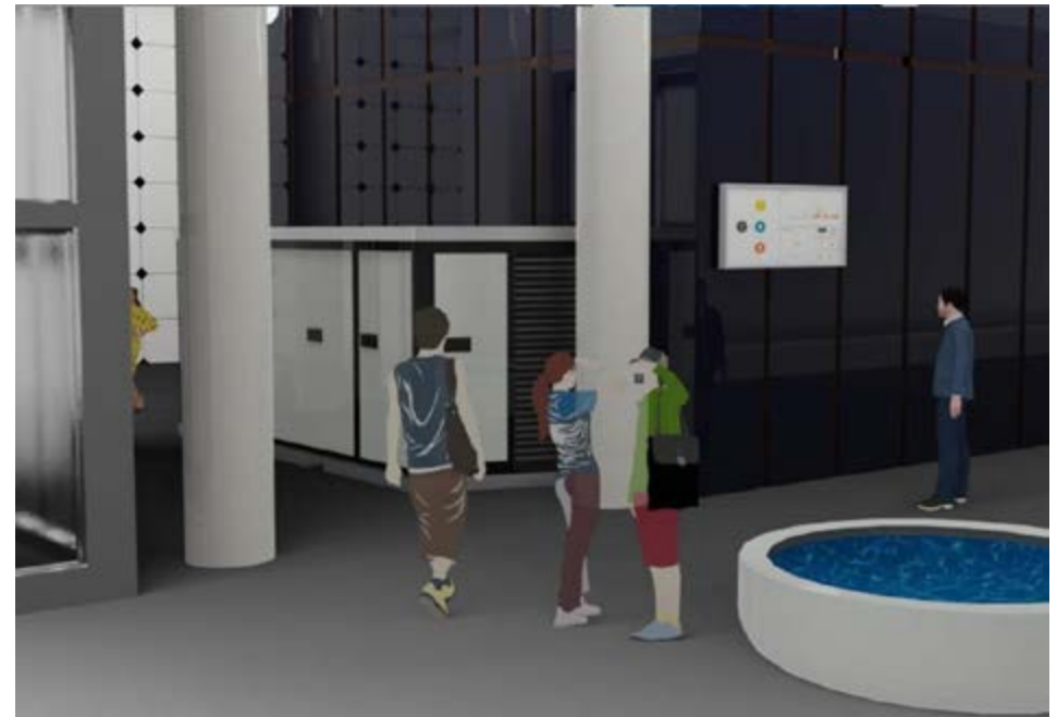
Artist impression: Stadsbatterij onderdoorgang Rijnstraat 8.

Het programmabureau van EnergieRijk Den Haag heeft een positief besluit genomen om te investeren in de aanschaf van een stadsbatterij, bestemd voor Rijnstraat 8. Ondanks dat de investeringskosten niet binnen de technische levensduur van de batterij worden terugverdiend, ziet ERDH meerwaarde in de leereffecten van een stadsbatterij in de praktijk. Door het opdoen en delen van ervaringen met de stadsbatterij helpt ERDH om de inzet ervan in vergelijkbare situaties en omgevingen mogelijk te maken.